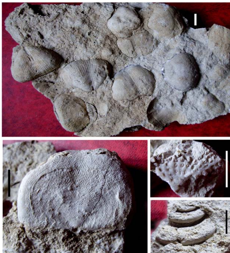
Морские беспозвоночные из елкинской пачки иренского горизонта кунгурского яруса; разрез «Греховская гора». Длина масштабной линейки – 1 см.

(2) Экскурсия на отложения кунгурского яруса, обнажающиеся в разрезе «Мазуевка». Отложения представлены песчаниками, аргиллитами и алевролитами кошелевской свиты иренского горизонта кунгурского яруса, в которых встречаются ископаемые остатки растений раннепермского возраста.