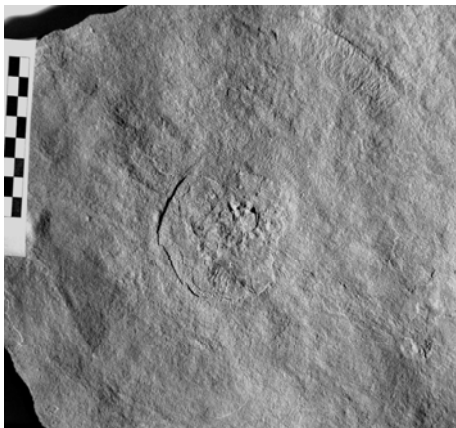
Рис. 1. Cyclomedusa sp. nov.

местонахождения, где добыто большое количество новых образцов, преимущественно из верхней и нижней частей разреза. Эти сборы во многом повторяют уже найденные ранее. Кроме того, нам удалось обнаружить новые формы, особенно интересные найдены в нижней части разреза (могилев-подольская свита). Среди этих новых форм особенно выразительны следующие открытия: (1) отпечатки крупных в диаметре и почти незаметных в рельефе медузоидов типа Cyclomedusa (рис. 1); (2) «ядра» полипов, у которых сохранились объемные следы мезентериальных (?) складок. Еще преждевременно делать их квалифицированное монографическое описание из-за небольшого числа экземпляров, которые не вызывают у нас сомнения (рис. 2). Здесь мы приводим первые изображения этих форм, полные описания которых будут сделаны нами в профессиональном издании.